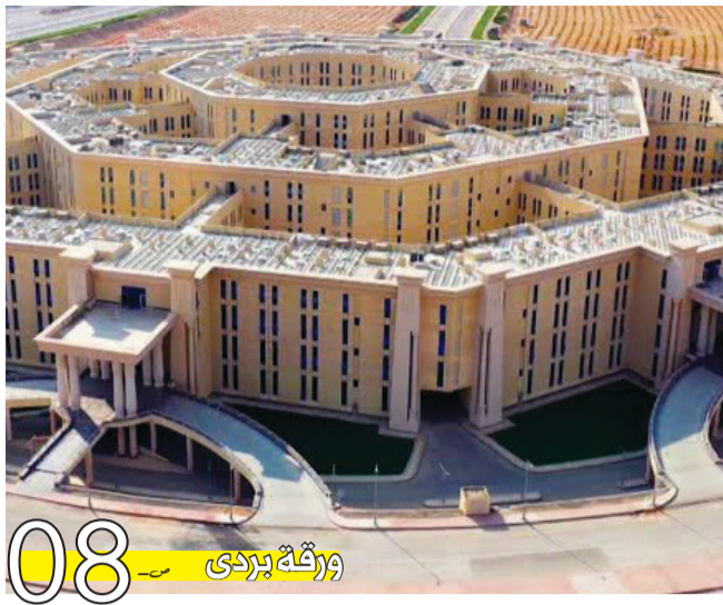
ورقة بردي 08

مصر القوية تبني جمهوريتها الجديدة وتحمي مقدرات شعبها ..